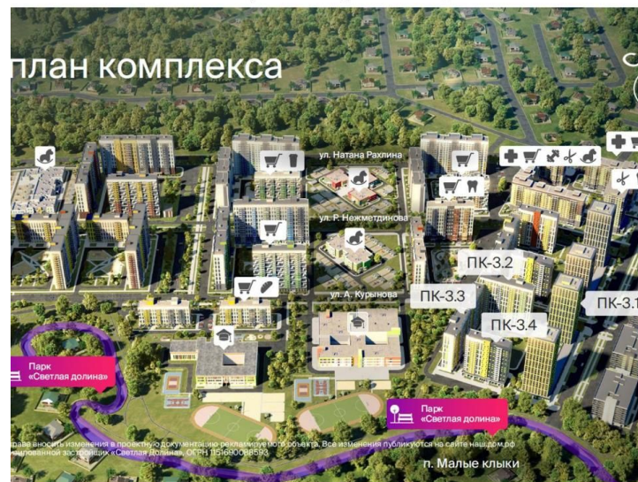
Генеральный план_ ЖК «Светлая долина»